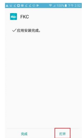
4. 安装完毕后即可打开APP