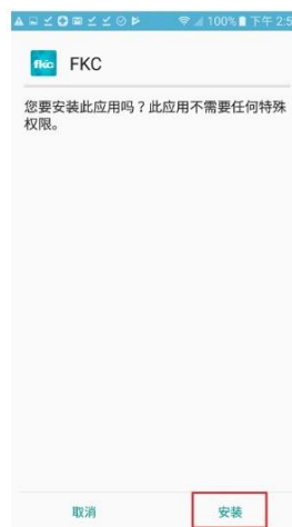
3. 点击并安装此文件